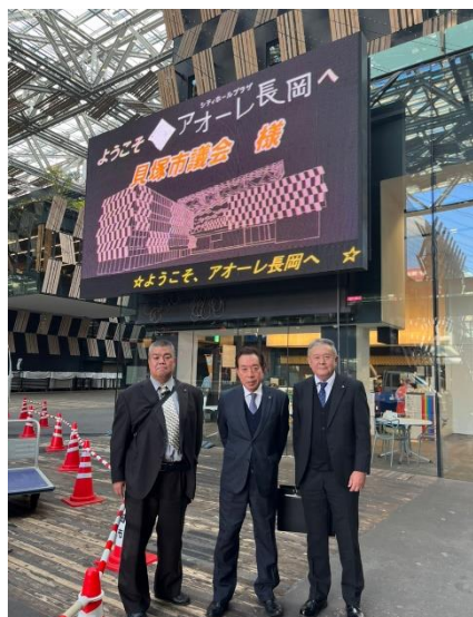
ナカドマで歓迎のメッセージ

さらに施設稼働率も令和 3 年度で 75.12%と非常に高く驚きました。これはやはり無料で利用で