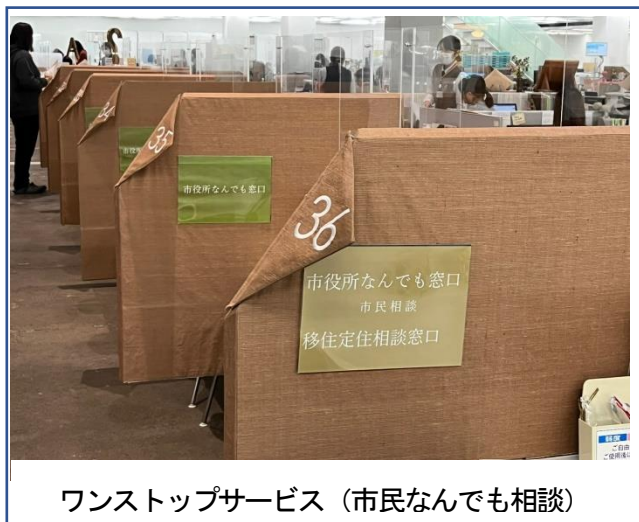
ワンストップサービス（市民なんでも相談）

市民サービスに力を入れ、ワンストップサービスを実現しております。「市役所なんでも相談」コ