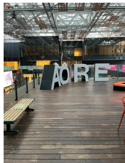
新潟産木材を使用したスペース